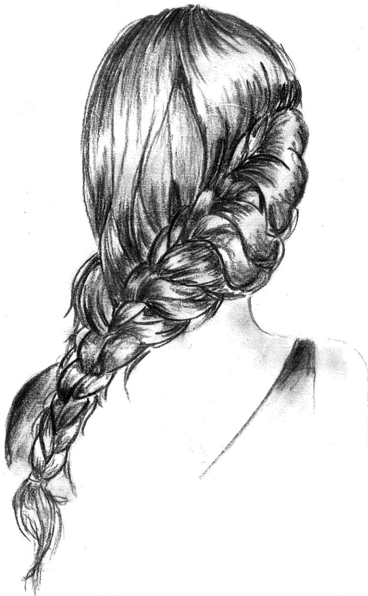
Nagy Renáta grafikája