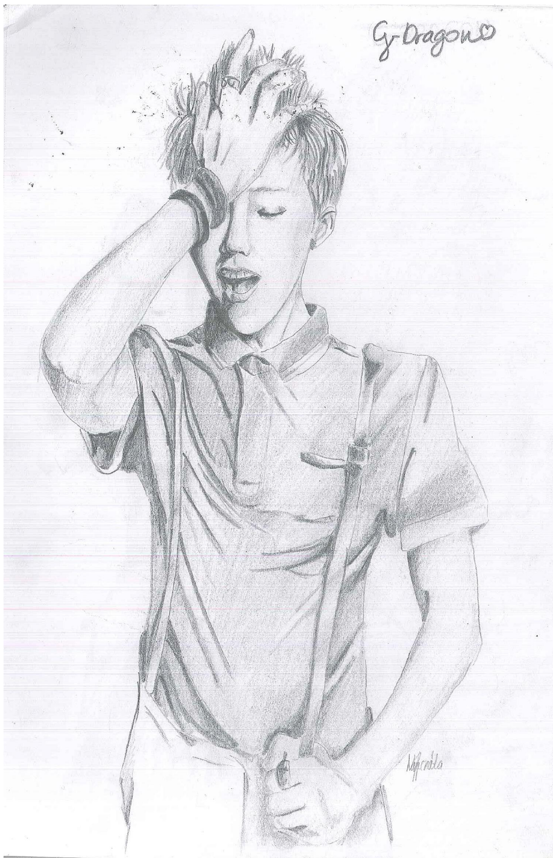
Nagy Renáta grafikája