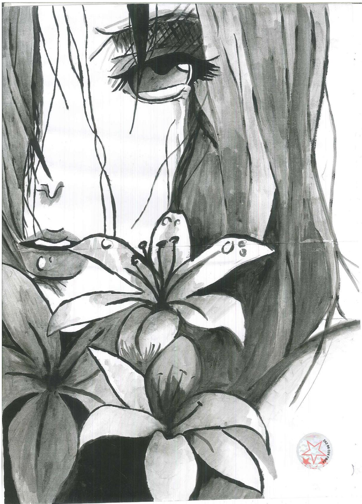
Nagy Renáta grafikája