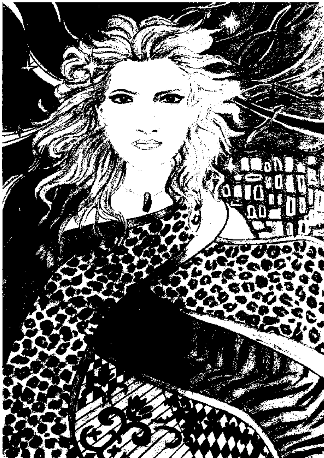
(Bedő Renáta grafikája)