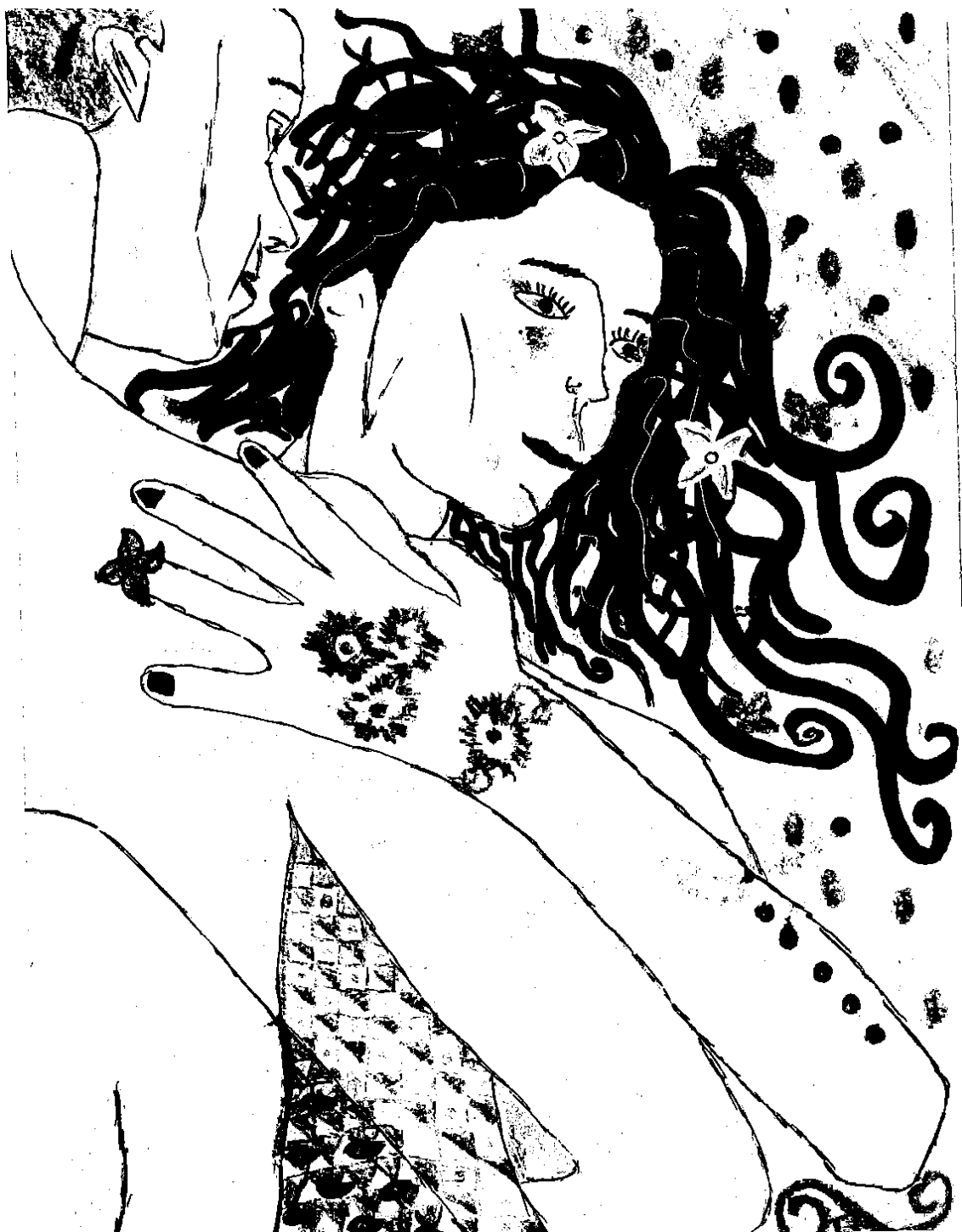
(Bakos Írisz grafikája)